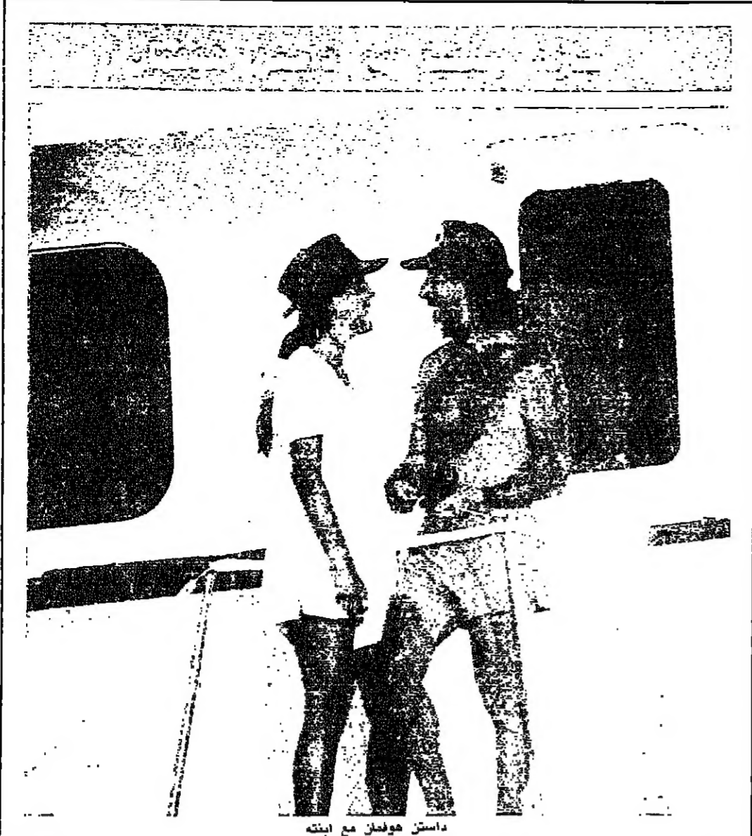
داستن هوفمان مع ابنته

ويشغل المهنيون حول ما اذا كان هذا التراجع في الاقبال ناجم عن اجناس علم الى الانخفاض عن السينما ام عن قاهرة عابرة عبر عنها الجمهور الاميركي احدث الجماهير العالمة انعمافاً على السينما وقبل ميك تريسي، و «ايام الرعد» لم تعرف الصالات الاميركية ايضاً انطلاقة قوية حتى مع